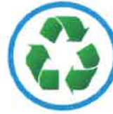
ความยั่งยืน