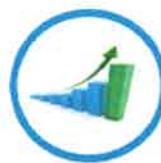
ความมั่งคั่ง