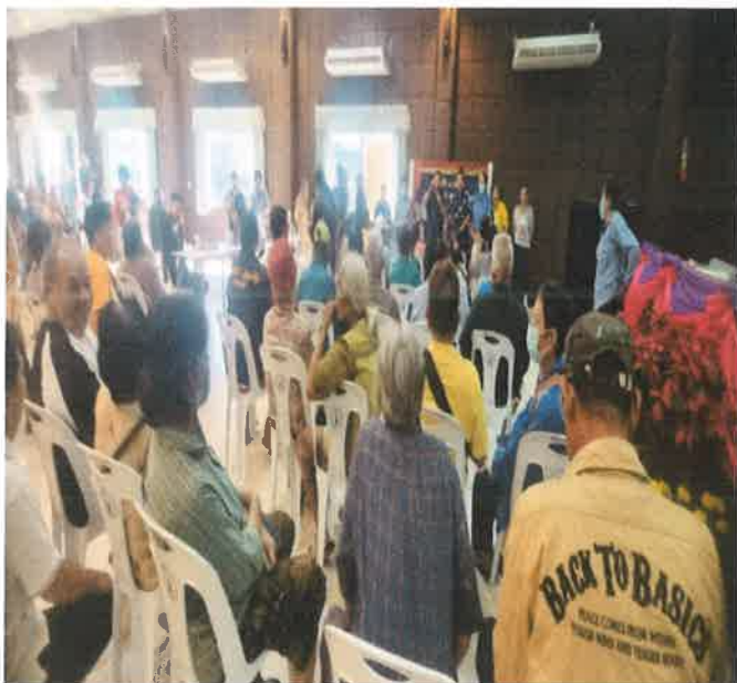
...ประมวลภาพกิจกรรมประชุมประชาคมหมู่บ้าน ประจำปี พ.ศ.๒๕๖๘...